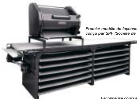
Premier modèle de façonneuse MAJOR conçu par SPF (Société de Panification Française)