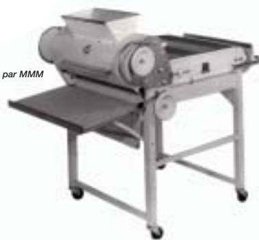
Façonneuse conçue par MMM

Le XIX ème siècle a vu l'essor de l'industrialisation et de la modernisation dans bien des domaines.