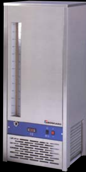
Refroidisseur L 90