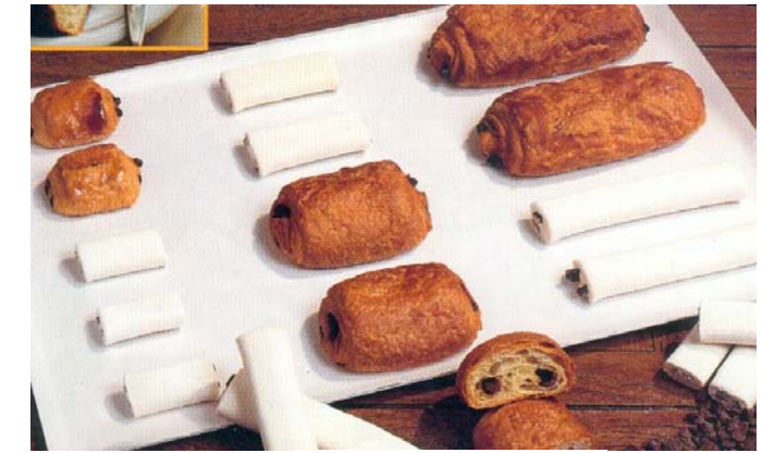
БУЛКА С ШОКОЛАДОМ