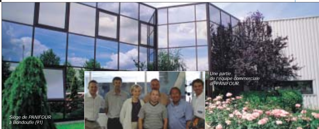
Siege de PANIFOUR à Bondoufle (91)

Concessionnaire BONGARD pour le Loiret (45) et l'Eure et Loir (28).