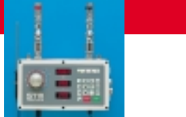
DOMIX 45A - Structure ABS - Sonde externe - Micro-dosage