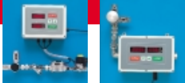
DOX 25M - Structure PVC

(Voir liste des adhérents en dernière page)