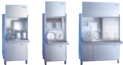
La gamme GS 604/650/660 de Winterhalter.